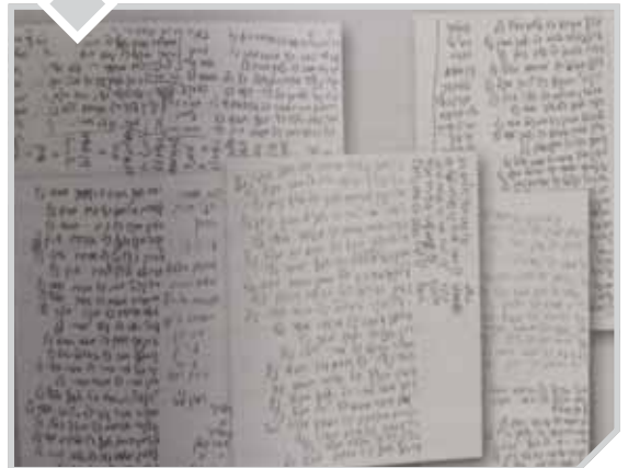
דפים מפנקסו של רבינו בהם רשומים שמותיהם של תלמידי הישיבה לתפילה

תלמידיו ידעו שהנושא הנושא אצלו ביותר הוא מצות תלמוד תורה ששקולה כנגד כולם, עד שלא יכל להבין את אלו שאינם מקפידים