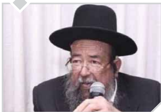
"אם כֶּסֶף תִּלְוֶה אֶת עַמִּי" (שמות כ"ב, כ"ד)

הגה"צ רבי ראובן קרלנשטיין זצ"ל: ברצוני לספר מעשה, שאם עוד לא שמעתם אותו - זה ממש יהלום